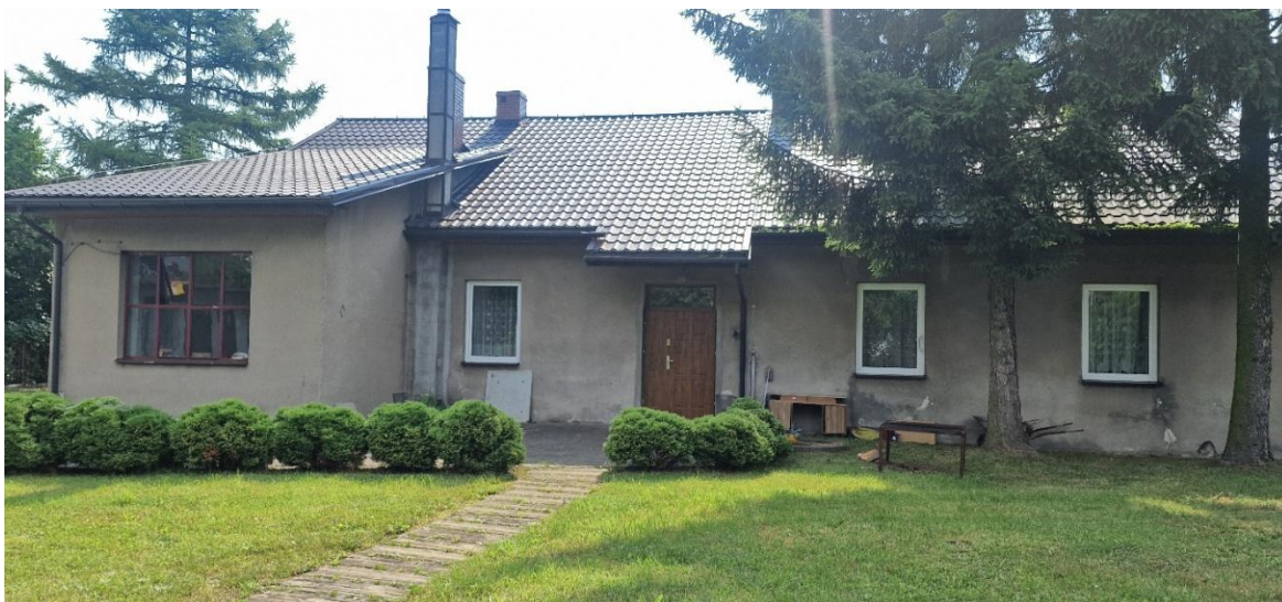
Zdjęcie Nr 4 – Elewacja zachodnia.