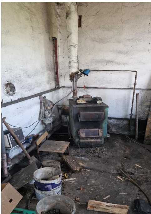
Zdjęcie Nr 1 – Piec na węgiel kamienny zlokalizowany w kotłowni.