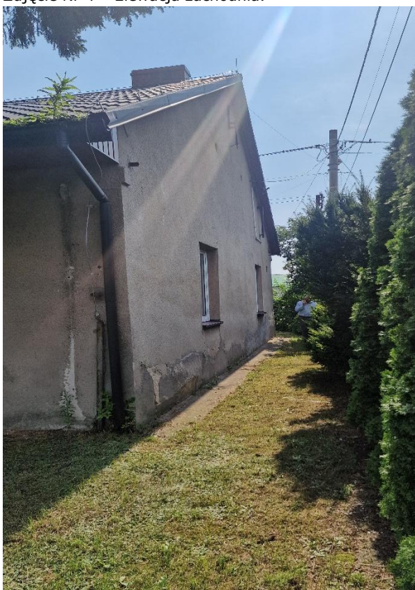
Zdjęcie Nr 5 – Elewacja południowa.